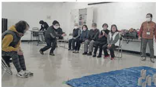
介護予防活動の様子