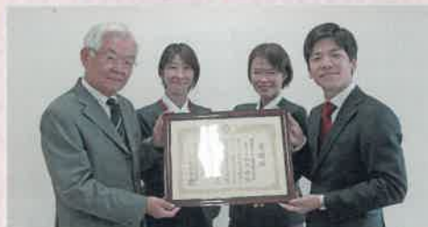
◀両毛ヤクルト販売株式会社様