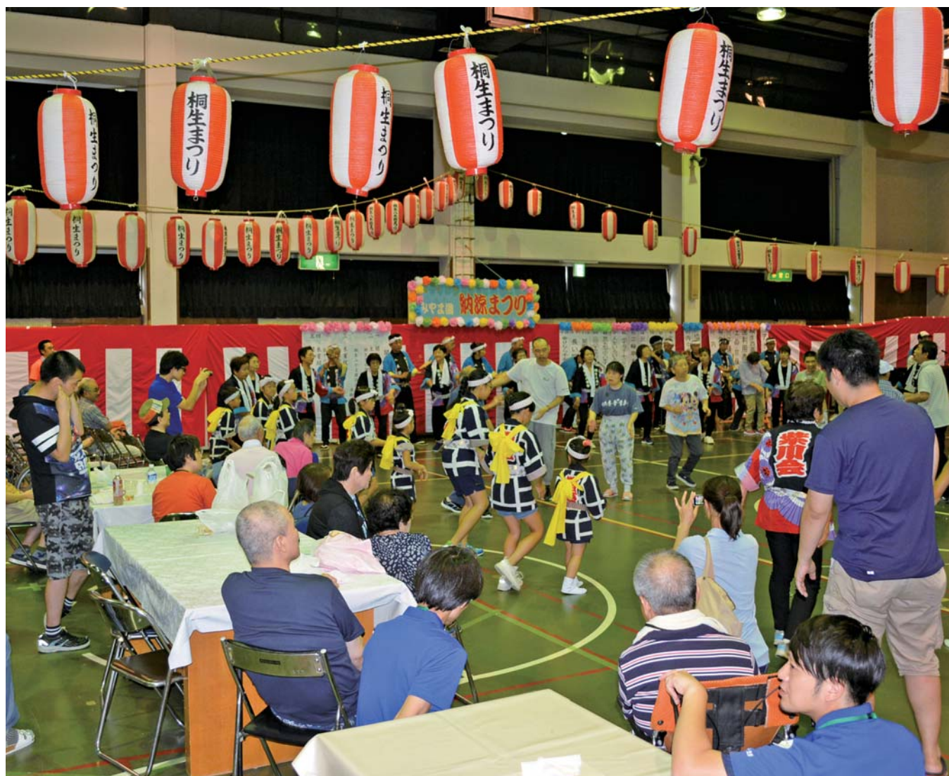
みやま園納涼まつり

発行／社会福祉法人 桐生市社会福祉協議会 〒376-0006 桐生市新宿3-3-19 TEL.0277-46-4165 FAX.0277-46-4166 ホームページ http://kiryu-csw.net