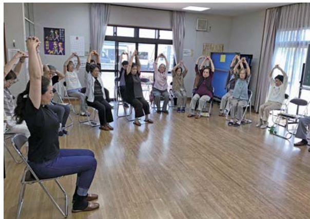
地域で実施されるサロン活動

地域で実施されるサロン活動、介護予防活動、自主防災活動、世代間交流活動に助成金を交付します。地区担当職員が運営を支援し、開催回数や場所を増やすなど、サロンの充実に取り組みます。また、サロン活動の担い手同士の情報共有、課題等の意見交換を行う交流会を開催します。