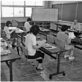
短文を用いての発声練習

時間が持てるようになり、何かボランティアをしたかった。本を読む難しさを改めて立てるよう努力したい。