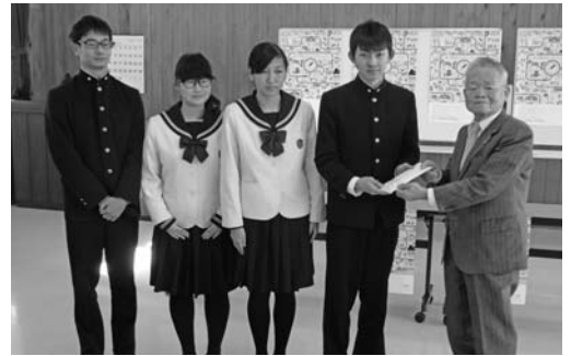
樹徳高校インターアクトクラブの皆さん

市内商業施設を主な活動場 所として、部員69人が募金活 動を行いました。歳末の寒い 時期でしたが、地域の方々か ら「頑張ってるね」と声をかけ てもらいました。募金協力者 のあたたかい言葉にとっても励 まされました。募金は地域福 祉のために役立てていただき たいです。