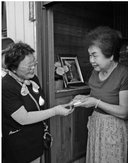
見守り活動の財源としても活用されます

入会申込書を地域福祉課へ提出してください。 申込書は同課又は社協ホームページにあります。