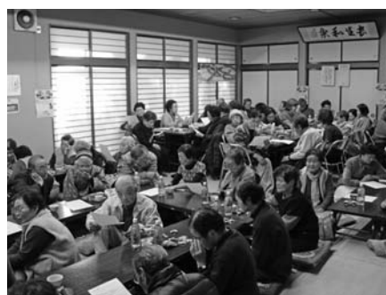
ふれあい・いきいきサロンの様子

受付から開会までの間、女性には職員によるネイルサービスがあり、手もとのおしゃべりを楽しみました。午前は、黒保根小学校の一年生によるかわいい歌声や合奏、職員によるふれあいトークやゲーム、保健師による病気になるない体づくりの話や軽い体操が行われました。昼食会を挟んで午後は、参加者有志によるカラオケ、全員参加のビンゴ大会を開催し、仮装した職員や民生委員も参加して大変盛り上がりました。