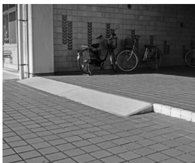
段差を解消した駐輪場

前回アンケートで要望があった自転車置き場の段差解消は、3月に改修工事を実施しスロープを設置しました。自転車止めやすくなったと好評を得ています。