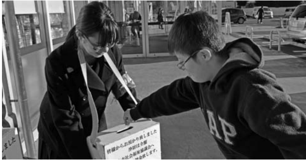
たくさんの方に協力いただきました

樹徳高校の活動は、今回で 39年間連続となり、寄付総額 は、41,796,195円 となりました。