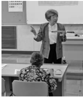
点字器の使い方の説明

初めは点字がまったく分からなかったが、仕組みを細かく教えてもらい、次第に楽しくなってきた。先輩の指導を受けながらコツコツ頑張りたい。