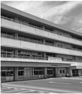
総合福祉センター

要な相談支援を行うことにより、その経済的自立を図り安定した生活を送れるようにすることを目的とします。実施主体である群馬県社会福祉協議会が貸し付け、借入申込者及び借受人に対する支援業務など業務の一部を受託し実施します。