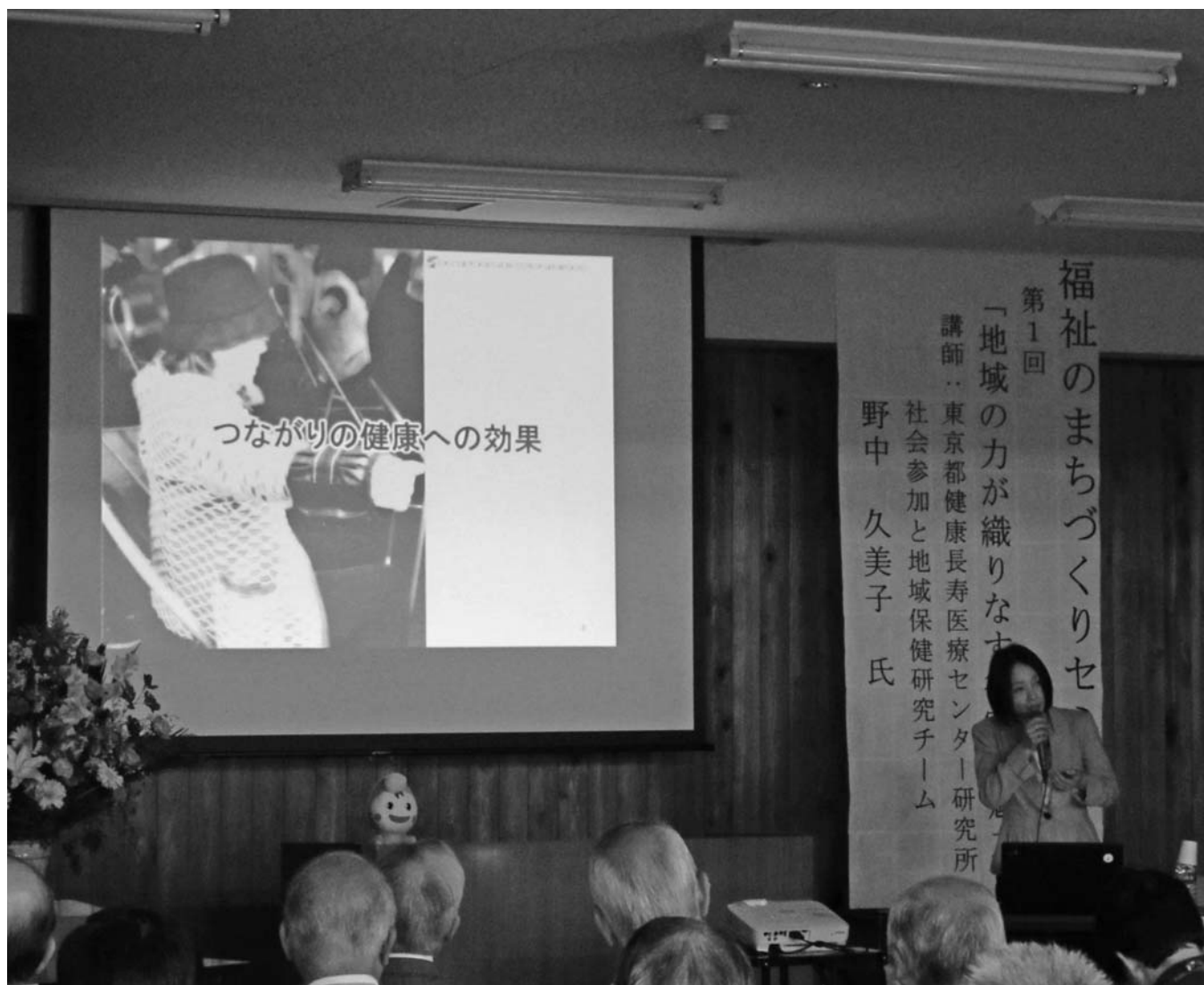
第1回「福祉のまちづくりセミナー」を開催しました

発行／社会福祉法人 桐生市社会福祉協議会 〒376-0006 桐生市新宿3-3-19 TEL.0277-46-4165 FAX.0277-46-4166 ホームページ http://kiryu-csw.net