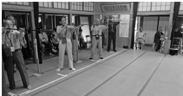
配分を受けて開催している吹矢教室