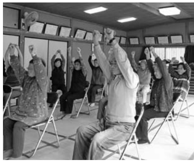
サロン活動の様子