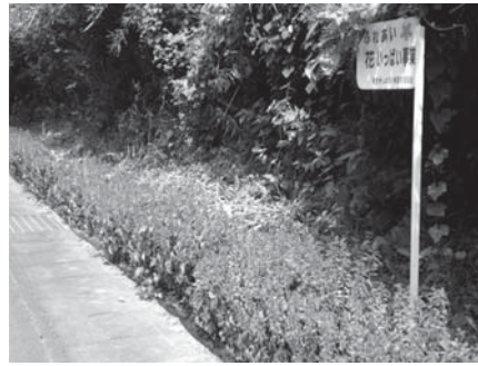
平成27年6月に植えたサルビア