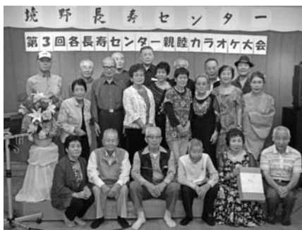
親睦を深めた出場者