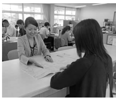
社協事務室の様子

第1次試験合格者に対する第2次試験は12月中旬、第2次試験合格者に対する第3次試験は平成28年1月中旬に行う予定です。