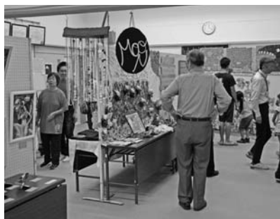
第15回文化展の様子

・くるみボタンを使った髪飾り作り ・プラ板キーホルダー ・元氣おりおり体操 ただし、髪飾り作りは材料費50円がかかります。