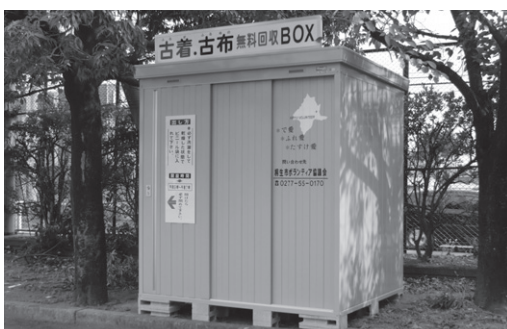
古着回収ステーション