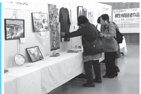
前回の作品展の様子

び祝日を除く）の間に申込書を社協総務係（総合福祉センター1階）へ持参、又は郵送してください。 試験案内及び申込用紙は社協の総務係、新里支所、黒保根支所、社協ホームページにあります。 なお、第1次試験合格者に対する第2次試験は12月上旬、第2次試験合格者に対する第3次試験は12月下旬に行う予定です。