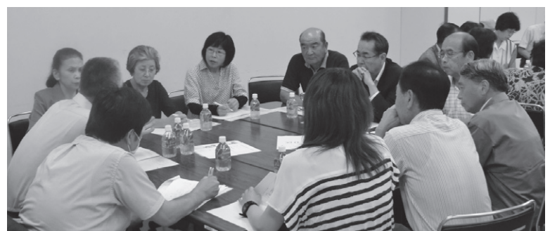
地区別懇談会（新里支所）