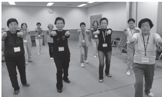
境野長寿センターの様子

この『元気おりおり体操』を高齢者のふれあい、憩いの場である美原、川内、境野、東の4長寿センターと広沢老人憩の家で、2年前から毎週