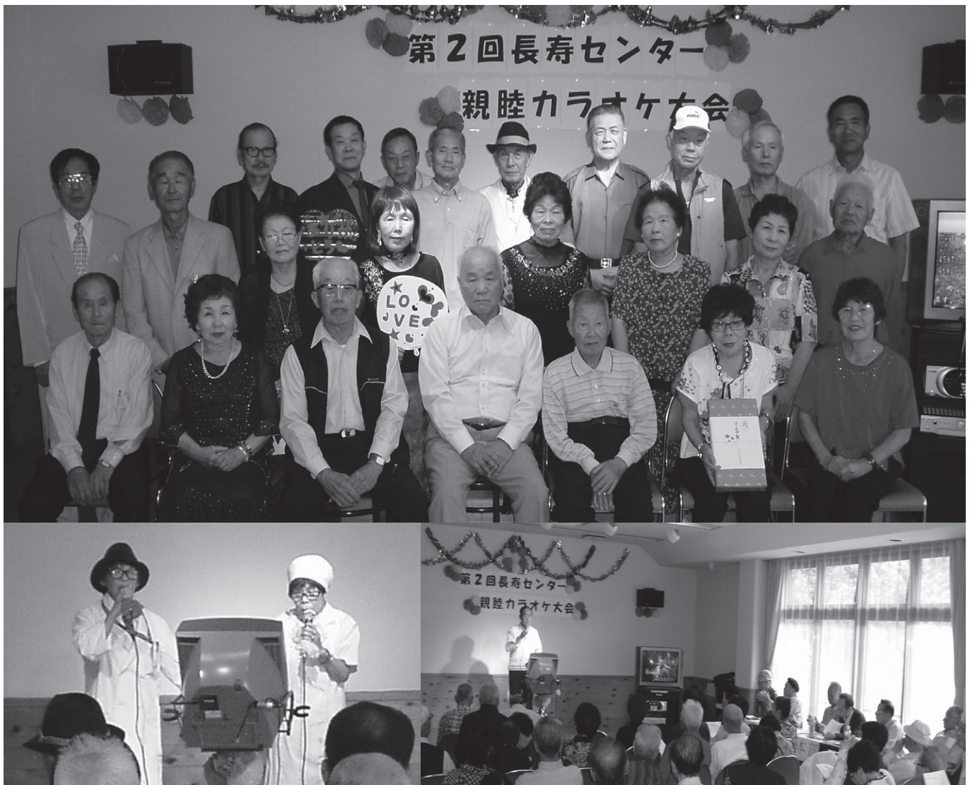
出場者と盛り上がるカラオケ大会

発行／社会福祉法人 桐生市社会福祉協議会 〒376-0006 桐生市新宿3-3-19 TEL.0277-46-4165 FAX.0277-46-4166 ホームページ http://kiryu-csw.net