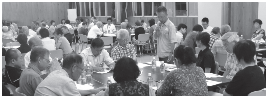
地区別懇談会（総合福祉センター）

■作成にあたって 社会福祉協議会（以下、社協）では、計画の効率的な周知を図り、その認知度を高め住民参加のもとに計画の推進を図るとともに、社協職員が地域に向いての見守り活動介護予防、サロン活動を進めることを第2次計画に反映していきます。