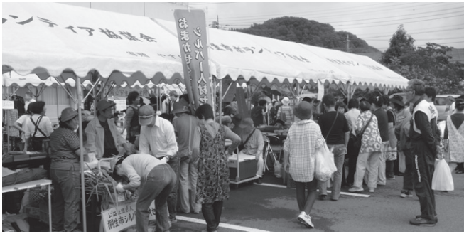
昨年のフェスティバル

保健・福祉・医療・生涯学習・ボランティアに携わる団体50団体が、自分たちの活動を広く知っていただくとともに、参加団体の連携をすすめる支え合いとふれあいにあふれるまちづくりに繋げていきます。