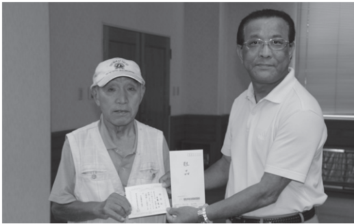
認定証交付（境野長寿センター）

7月30日、初めて一巡した方が黒保根老人休養センターで誕生したほか9月11日現在、16人の方が一巡、7人の方が二巡、そして三巡の一番乗りも出ています。