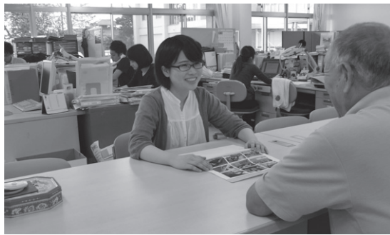
社会福祉協議会事務局

び祝日を除く）の間に申込書を社協総務係（総合福祉センター1階）へ持参、又は郵送してください。 試験案内及び申込用紙は社協の総務係、新里支所、黒保根支所、社協ホームページにあります。 なお、第1次試験合格者に対する第2次試験は12月上旬、第2次試験合格者に対する第3次試験は12月下旬に行う予定です。