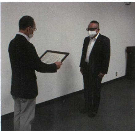
感謝状贈呈の様子

株式会社アスパックス様は、みやま園なるかみ寮の生産活動の一環として、段ボール組立作業を5年にわたり提供いただいています。作業を行うなるかみ寮の利用者さんは、作業工賃を得るだけでなく、その作業を社会との接点と感じ、生きがいを持って取り組んでいます。改めて、長年のご貢献に対し感謝申し上げます。