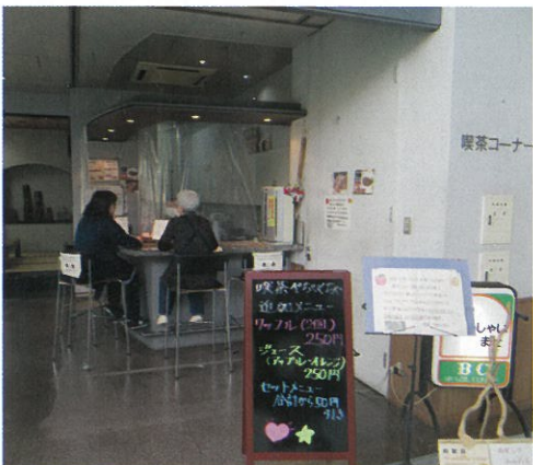
喫茶ぺちやくちやの様子