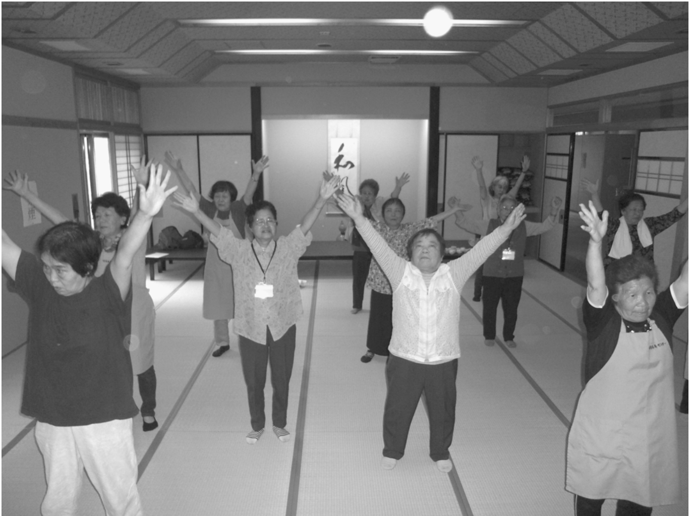
「元気おりおり体操」で頑張っている皆さん(川内長寿センター)

発行／社会福祉法人桐生市社会福祉協議会 〒376-0006 桐生市新宿3-3-19 TEL.0277-46-4165 FAX.0277-46-4166 ホームページ http://kiryu-csw.net