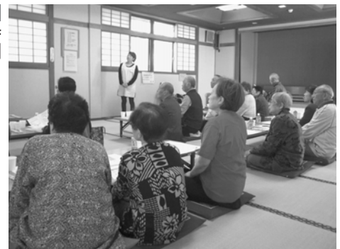
◀ 昨年度の介護予防教室