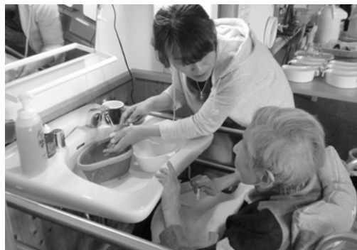
◀ デイサービスでは、口腔ケアに取り組んでいます。

・精神障害者など、判断能力が不十分な方が、安心して地域生活を送れるよう、桐生市・みどり市を実施地域として福祉サービス利用援助、日常的な金銭管理サービス、書類等預かりサービス等の支援を行いました。