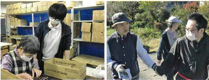
障害者支援職・桐生みやま園の作業支援と健康づくり支援