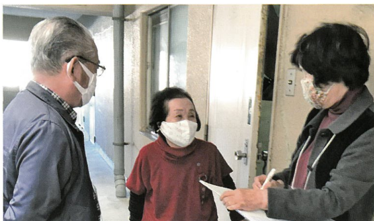
新型コロナウイルス感染症対策をしながらの訪問