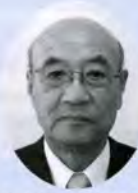
桐生市社会福祉協議会 会長