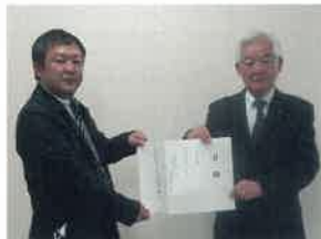
株式会社ダイナム様