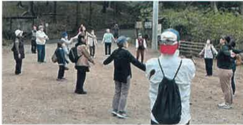
高齢者の通いの場「サロン活動」