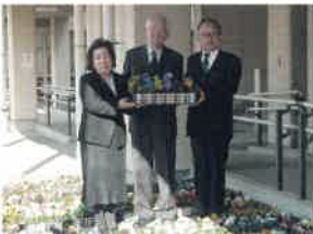
桐生典礼株式会社様